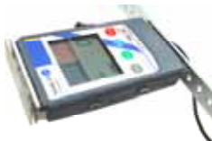
図4 イオンバランス測定

固定ブラケットの設置は図 4 を参照してネジで固定場所に取り付けて下さい。ねじ穴はφ 4.2mm 径で15mm ビッチになっています。