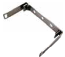
図2 固定用ブラケット